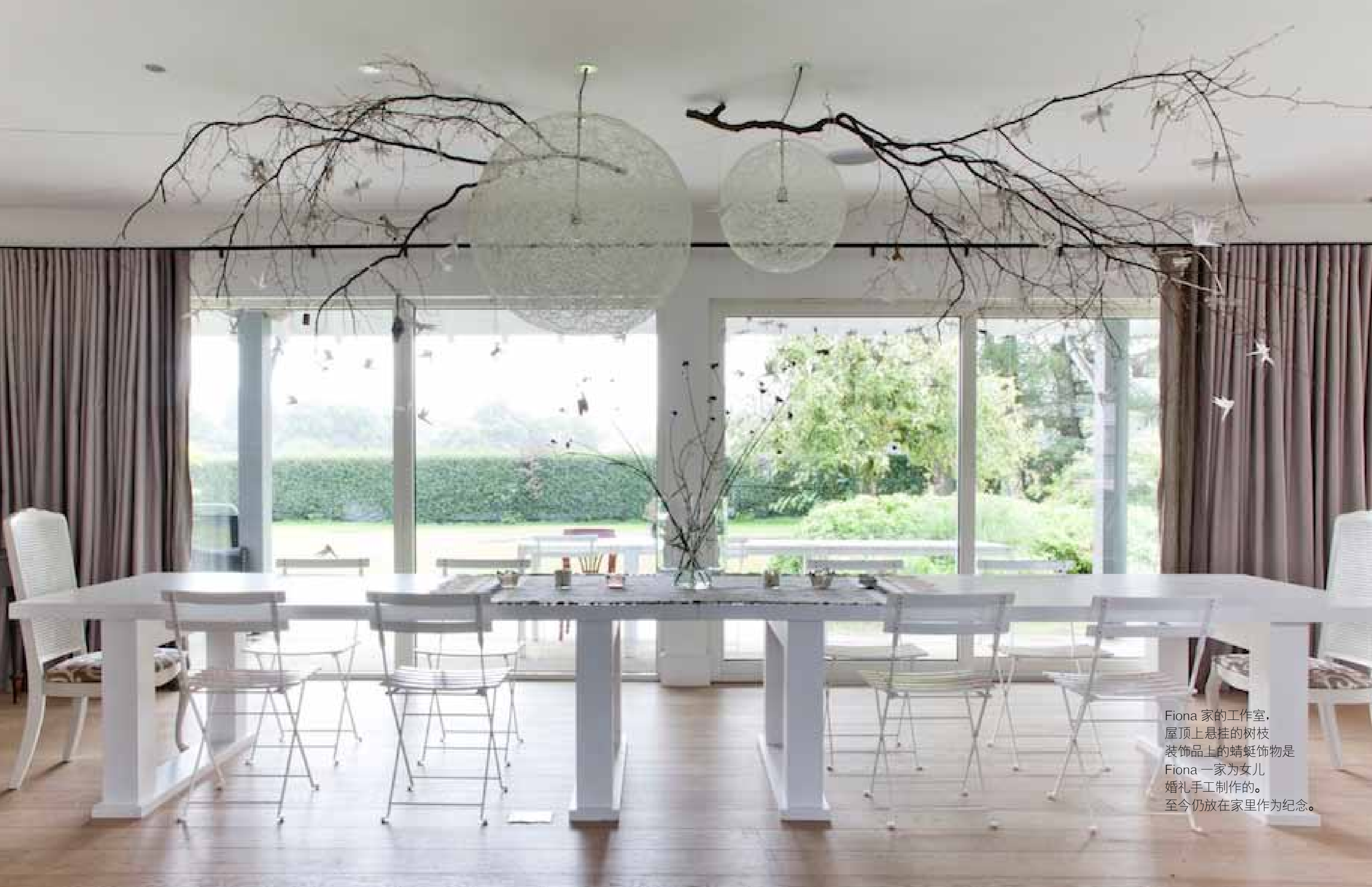
Fiona 家的工作室， 屋顶上悬挂的树枝 装饰品上的蜻蜓饰物是 Fiona 一家为女儿 婚礼手工制作的。 至今仍放在家里作为纪念。